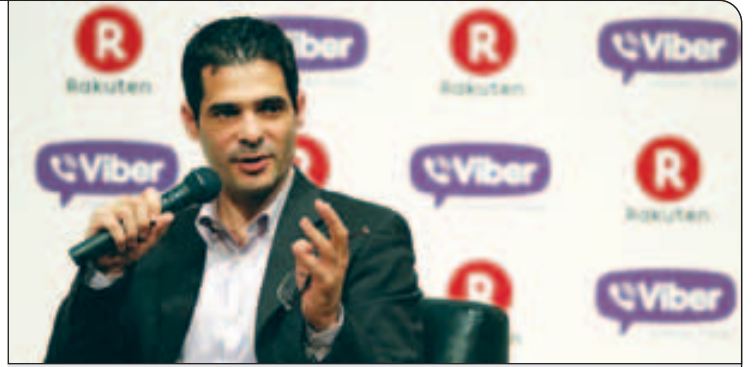
تعداد کاربران ایرانی که از وایبر استفاده می‌کنند از سایر نقاط جهان بیشتر بوده و ما در استفاده از وایبر اول شده‌ایم

تا جایی که من اطلاع دارم وایبر برای مدتی در ایران بلاک بوده و البته وادفون هم این برنامه را بلاک کرده است. کشورهای دیگری نظیر امارات، چین یا مصر هم در برخی موارد سخت‌گیری‌هایی در این زمینه داشته‌اند.